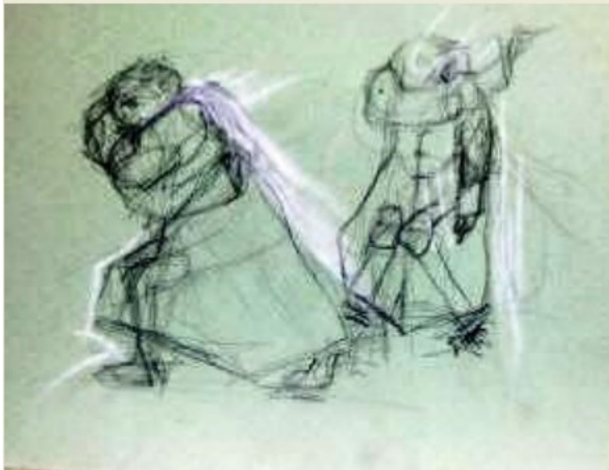
Im Spiegel sehe ich, wie bleich ich bin

»Mit seinen zeitgeschichtlich orientierten, politisch sensiblen Stücken bestätigt Thomas Strittmatter seinen Ruf, einer der interessantesten deutschen Nachwuchsdramatiker zu sein.« Der Spiegel